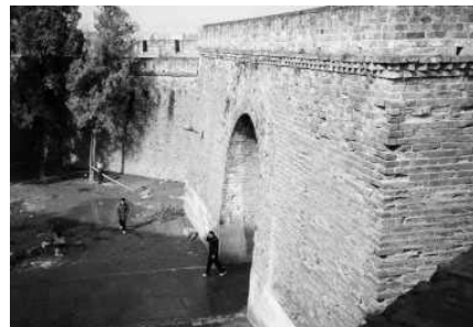
荊州古城（イメージ）