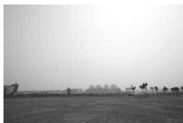
武漢全民健身活動中心（イメージ）