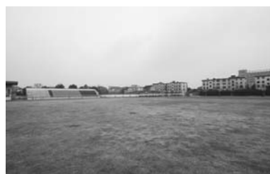
余新鎮中学校（イメージ）