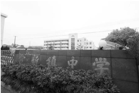
余新鎮中学校校門（イメージ）