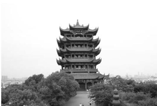
武漢黄鶴楼（イメージ）