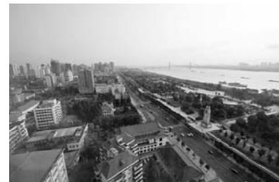
武漢市内（イメージ）