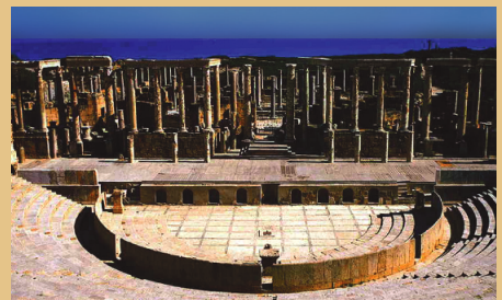
観光で訪れるリビアの古代ローマ時代の遺跡、レプティス・マグナ(イメージ)