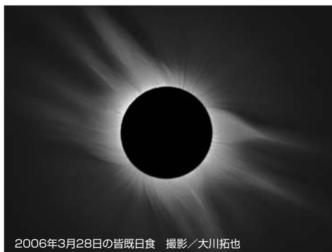
2006年3月28日の皆既日食